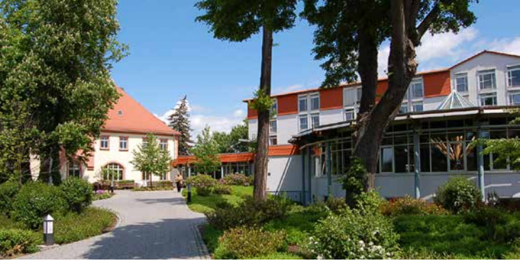
Die Celenus Klinik an der Salza