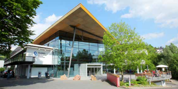
Die Celenus Klinik für Neurologie Hilchenbach